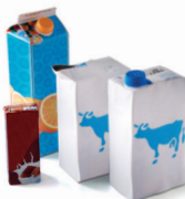
Cartonnettes & briques alimentaires