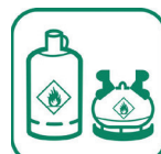
BOUTEILLES DE GAZ