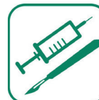
DÉCHETS D'ACTIVITÉS DE SOINS À RISQUES