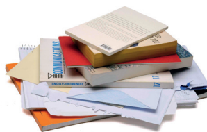
Tous les papiers : revues, journaux, livres magazines, enveloppes, annuaires, catalogues...

À JETER ? À RECYCLER ? POUR TOUT SAVOIR, TÉLÉCHARGEZ L'APPLI GUIDE DU TRI