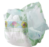
Films & sacs plastiques