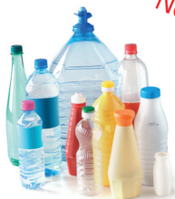
Bouteilles & flacons en plastique